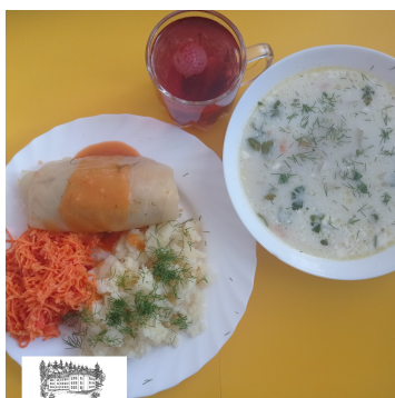
30.10.23 OBIAD - DIETA OGÓLNA