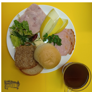
31.10.23 ŚNIADANIE - DIETA OGÓLNA