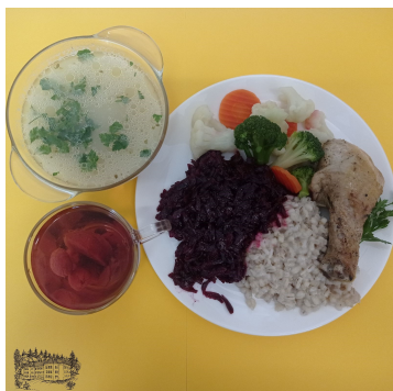
31.10.2023 OBIAD - DIETA OGÓLNA

Przedstawiamy jadłospis na tydzień 30.10. - 5.11.23 r.