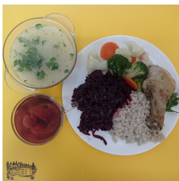
31.10.2023 OBIAD - DIETA OGÓLNA