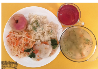
02.11.2023 OBIAD - DIETA CUKRZYCOWA