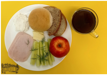
06.11.23 ŚNIADANIE - DIETA LEKKOSTRAWNA