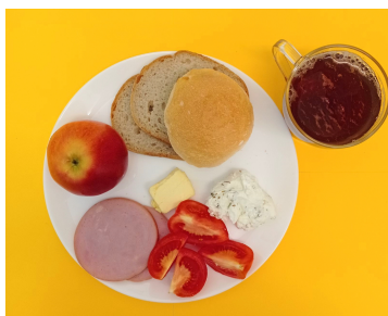
22.01. ŚNIADANIE - DIETA LEKKOSTRAWNA